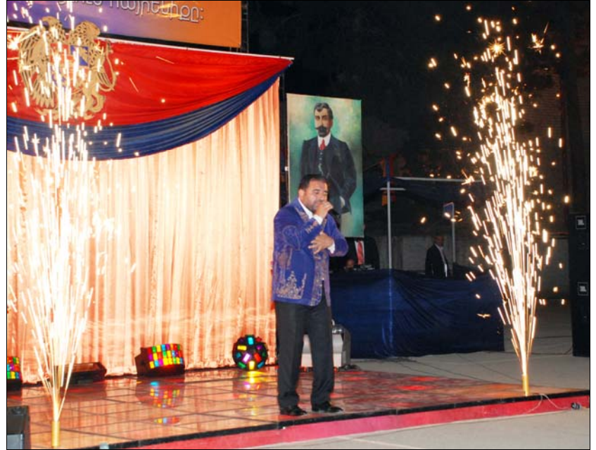
Մայիս 28-ին նկրած տոնակատարությունն ասարուեց շքեղ հրավառությամբ: Յատկանշելի էր, որ «Ռուբէն»