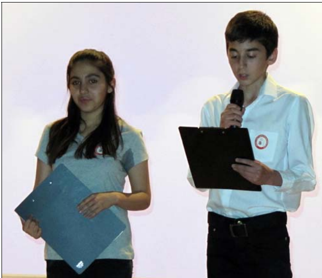
Երկու դպրոցների պատասխանատուներից եւ