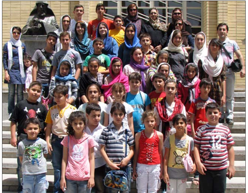
Երկուշաբթի՝ յունիսի 25-ի առաւօտեան, ուսուցչական կազմը եւ մի խումբ օժանդակող ծնողներ, Կիրակնօրեայ Դպրոցի սաների հետ մէկօրեայ այցելութիւն եւ զբօսանք կատարեցին:

խացուցիչ մթնոլորտում բոլորը տուն մեկնեցին գոհունակ: ***