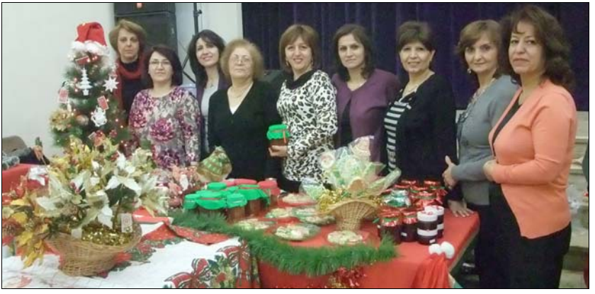
Ամէն տարի Ընկերութիւնը մասնակցում է Ն.Զ. Հայ Մ.Մ. «Արատ» Միութեան կողմից կազմակերպած Ամանորեայ վաճառքին:

Ամէն տարի ամուսն վերջի ամսան, Ս.Ա. Վանքի ցուցասրահում կազմակերպւում է վաճառք-ցուցահանդէս, որում համայնքի արեւտասէր կանանց ձեռքի աշխատանքները եւ գործածքները վաճառքի են դրում եւ այցելուների կողմից գնահատանքի արժանանում: