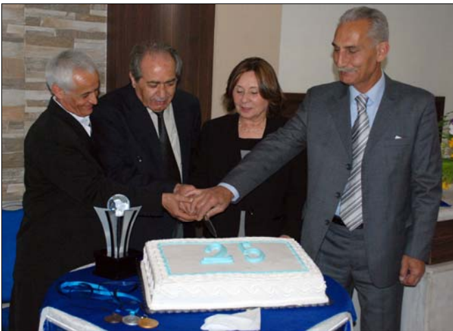
2013 թականի մարտի 20-ին, 25-րդ Գարնանային

խաղերի բացման հանդիսութեան աւարտին, Միութեան սրահին կից դահլիճում նշեց Գարնանային խաղերի 25-ամեակը, որտեղ ներկայ էին Նոր Զուղայի, Թեհրանի եւ Ծահինջահրի պաշտօնական հիւրերը, վետերանները, բացման ծրագիրը իրականացնող պատասխանատուները եւ միատորների ներկայացուցիչները: