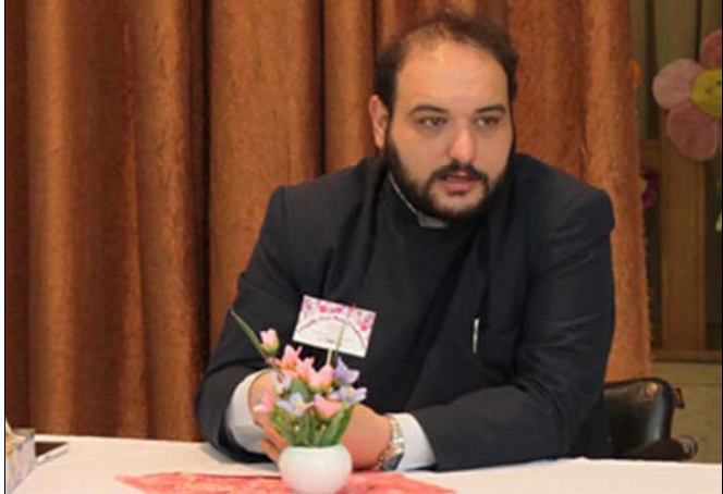
Հոգշ. Հայր Սուրբն իր խօսքում մի այլ տեղ նշեց. «Հայ մայրը տեսել է շատ բաներ, ինչպիսին են Եղեռն,

մի սրբութեան մասին»: Ապա մէջբերելով բանաստեղծի խօսքերը, թէ՛ «Ինչե՛ր ասես որ չեն արել այս ձեռքերը» ու աւելացնելով՝ «Կամ չեն տեսել այս աչքերը» եւ փոխ առնելով երգի բառերը թէ՛ «Խորնարհում ենք մեք ձեր առաջ», ասաց. « Խոնարհւել նշանակում է՝ հոգով խորնարհ եւ հեզ լինել մօր նկատմամբ »: