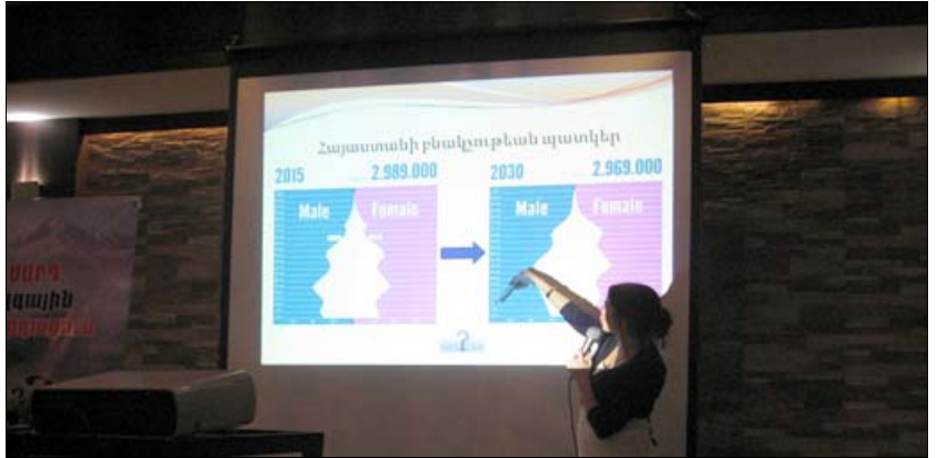
Առաջարկներ հնչեցին նաեւ երկրի տնտեսական զարգացման ուղղութեամբ, իսկ վերջում քննարկեց հայապահպանման հիմնահարցը:

թիւնները եւ առկայ խնդիրների վերացման ուղղութեամբ նրանց առաջարկները, ովքեր հասատեցին, թէ պետութեան գոյատեւման եւ ծրագրերի իրականացման համար՝ անհրաժեշտ է կայուն տնտեսական իրավիճակ, զինուժ եւ հզօր կամք: Իսկ բնակչութեան թիւ աճի կապակցությամբ բոլորը հասան այն եզրակացութեան, որ պէտք է պետական մակարդակով յատուկ աջակցութիւն ցուցաբերի բազմազան ընտանիքներին եւ հարկ եղածը նախաձեռնի նման ընտանիքների ստեղծման ուղղութեամբ, չմոռանալով նաեւ արտագաղթի թափը կտրելու համար երկրի քաղաքական եւ տնտեսական իրավիճակում բարեփոխումների կիրառումը: