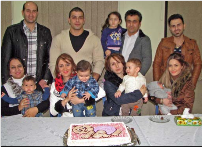
Հոգշ. Հայր Սուրբի խրատական խօսքերից յետոյ, Ծահինշահրի հայ համայնքի վարչութեան աստեճապետ

նակ խօսքեր արտայայտեցին, որի հիման վրայ հոգշ. Հայր Սուրբն առաւել երջանկութիւն մաղթեց բոլորին եւ յոյս յայտնեց, որ նրանք բարի օրինակներ են լինելու համայնքի երիտասարդութեան եւ նորակազմ ընտանիքների համար: